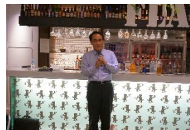
フランダース・テイル (ハービス PLAZA)