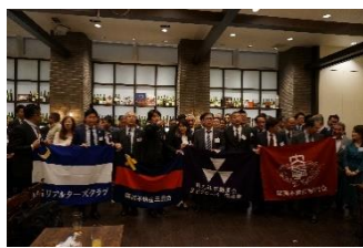
レストランテ コローナ